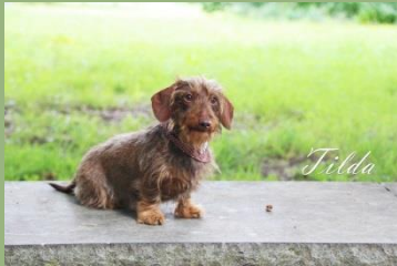
Tilda freut sich jedes Mal aufs Neue auf die Kinder der Arche Noah

Die Angebote mit Tilda müssen aber gar nicht immer nur aktiv geschehen. Alleine ihre Anwesenheit während einer Traumreise oder beim Lesen einer Geschichte, bringt ein Gefühl von Ruhe und Wohlbefinden.