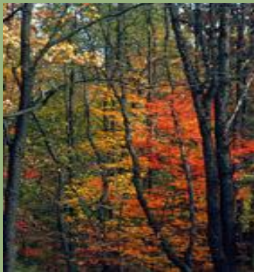
Weitere Infos von Naturleben für Eltern: https://www.naturleben.eu/naturleben/für-eltern/